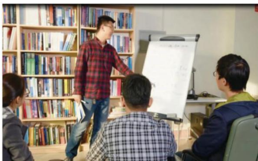
丰富多彩的书院文化和学术活动

2. 提升学生综合素质。 着力推行“五育并举”，养成学生健全人格。不唯考试分数，把综合素质提升纳入人才培养方案和综合测评指标体系，建设“综合素质课程”成绩单制度和成长信息系统，围绕德智体美劳五个模块，科学设置评价指标，实时记录学生的成长；强化日常锻炼和兴趣培养，倡导每一位学生掌握一项终身受益的体育项目；邀请名师开设书法、艺术鉴赏、合唱等课程，组织创意大赛、文艺晚会，提高审美和人文素养；鼓励学生开展劳动实践、志愿服务，引导学生尊重劳动，磨砺意志；举办“青春创新奋进”学术科技文化活动、“聚英萃华”学术素质拓展月、导师见面会、诺奖解读、校友论坛、辩论赛等活动；成立理论宣讲及各类兴趣小组，促进学生德智体美劳全面发展。