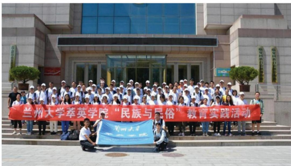
萃英学院师生赴甘肃临夏开展“民族与民俗”社会实践