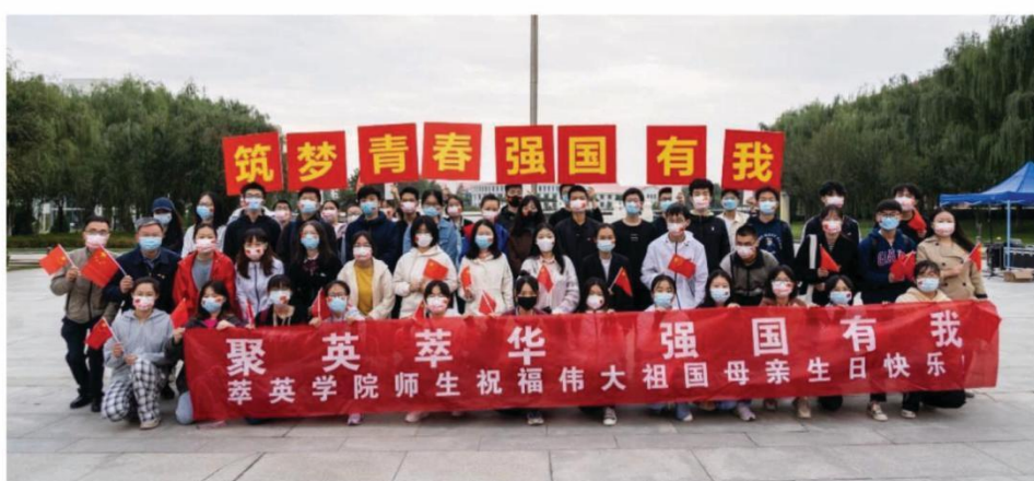
萃英学院师生参加国庆升旗仪式